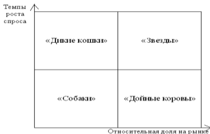
Рис. 1. Матрица БКГ

Матрица БКГ позволяет организации классифицировать каждый из своих товаров по его доле на рынке относительно основных конкурентов и темпам роста отрасли. Матрица дает возможность определить, какие товары занимают ведущие позиции по сравнению с товарами - конкурентами, какая динамика их на рынке, позволяет произвести распределение финансовых ресурсов между ними. Предлагается следующая классификация товаров: «звезды», «дойные коровы», «дикие кошки», «собаки».