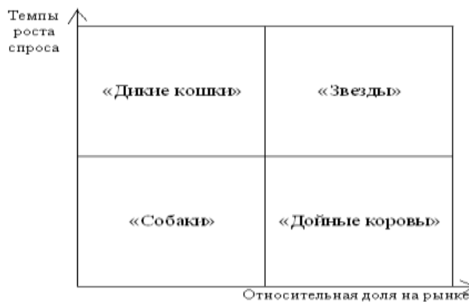
Рис.1. Матрица БКГ

Матрица БКГ позволяет организации классифицировать каждый из своих товаров по его доле на рынке относительно основных конкурентов и темпам роста отрасли. Матрица дает возможность определить, какие товары занимают ведущие позиции по сравнению с товарами - конкурентами, какая динамика их на рынке, позволяет произвести распределение финансовых ресурсов между ними. Предлагается следующая классификация товаров: «звезды», «дойные коровы», «дикие кошки», «собаки».